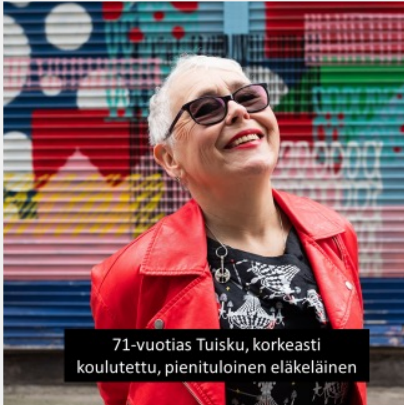
71-vuotias Tuisku, korkeasti koulutettu, pienituloisen eläkeläinen

”Elämä on hyvää. Tulot ovat pienentyneet, mutta eipä niitä tarpeitakaan niin enää ole. Meillä on puolison kanssa paljon ystäviä, joiden kanssa voimme jakaa ilon ja murheet, ja käydä kerhoissa. Luotan mediaan ja luen aamuisin lehden ja katson illalla uutiset televisiosta. Arvostan sitä, miten vahvasti Suomi vaikuttaa EU:ssa nykyään ja että me kannetaan vastuuta myös niistä, joilla menee maailmalla huonommin. Joskus ihmisten vihaisuus, rikollisuus ja rasismi kyllä pelottaa, ja toki ilmaston tila huolestuttaa. Pelkoja vähennän parhaani mukaan varautumalla: turva-sovellukset on aktivoitu, ulko-ovessa on kasvojentunnistin, palovaroitin on sisäänrakennettuna kattoon ja seuraan viranomaisten suosituksia turvallisuuteen liittyen. Tunnen oloni turvalliseksi, sillä tiedän, että poliisi, palokunta ja ambulanssi tulevat paikalle tarvittaessa.”