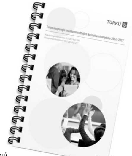
Kaupunginvaltuusto hyväksynyt 10.3.2014