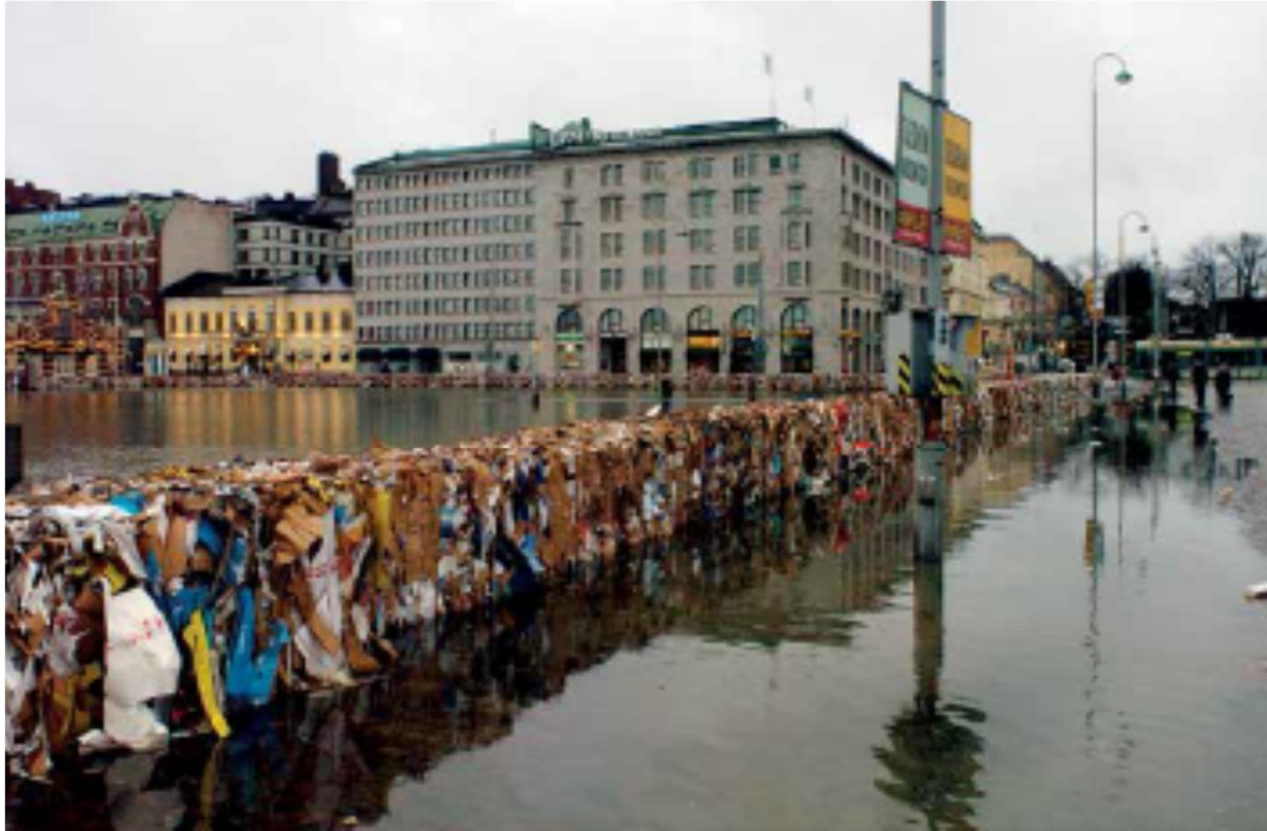
Voimakas talvimyrsky 10.1.2005 nosti merivettä Helsingin Kauppatorille.