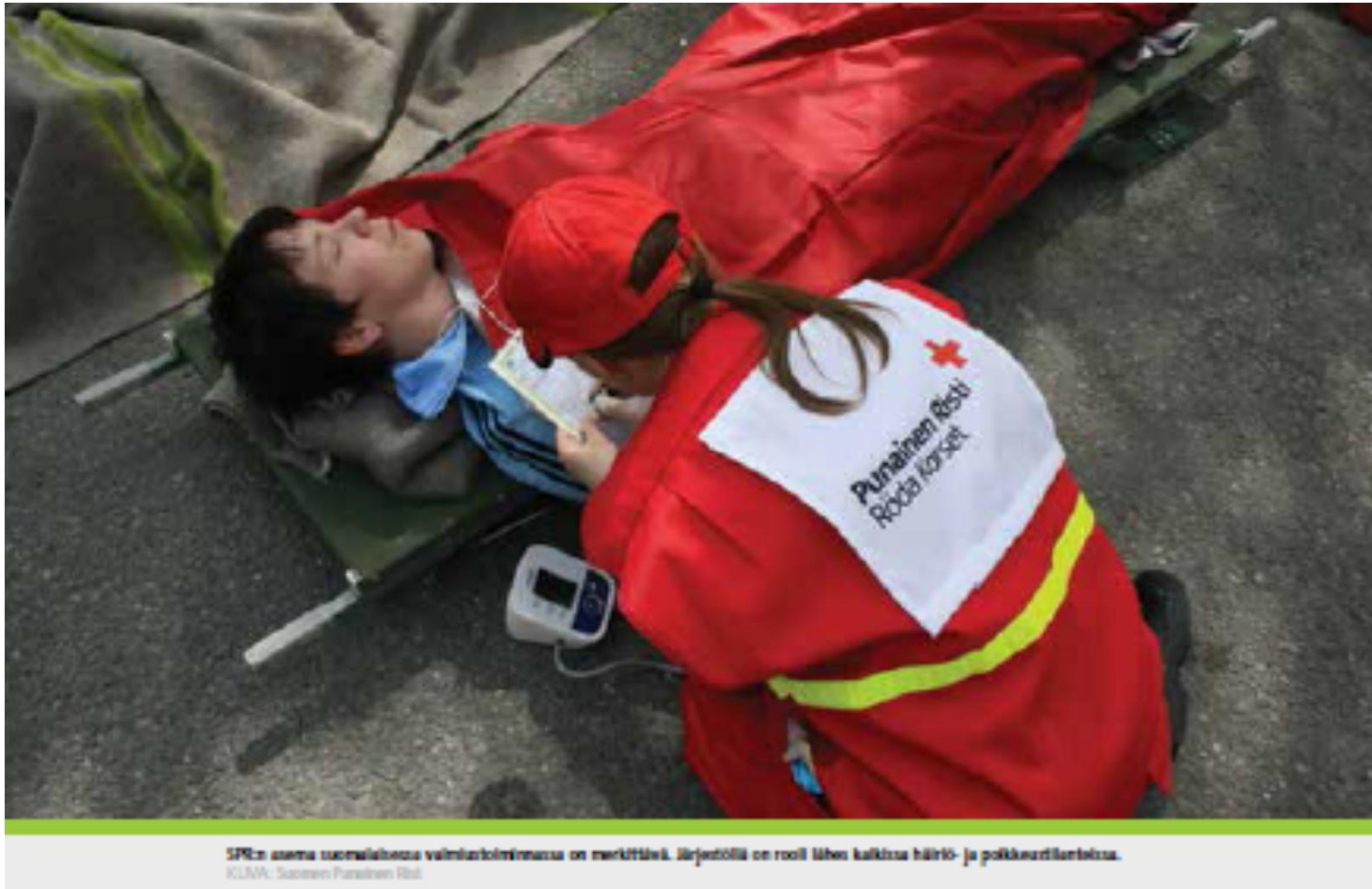
SFR:n asema suomalaisessa valmistusketjussa on merkittävä. Kirjastoilla on rooli lähes kaikissa häiriö- ja poikkeustilanteissa. KUNN: Suomen Punainen Risti

Pelkäätkö sairautta, tarttuvaa tautia tai epidemiaa?